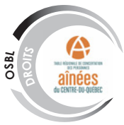
Table régionale de concertation des personnes âgées du Centre-du-Québec

Amélioration des conditions de vie des personnes âgées du Centre-du-Québec. Ses orientations sont de faire connaître « la réalité, les besoins et les compétences » des aînés. À cet effet, la Table régionale constitue l'instance la plus représentative des personnes âgées de la région du Centre-du-Québec et agit comme conseillère auprès des instances aînées locales, régionales et provinciales. Le principal mandat de la Table régionale est de favoriser la concertation des acteurs et partenaires des cinq MRC. Ce processus de concertation, que la Table régionale initie, instaure et soutient, doit constamment être incité, cultivé et encouragé, pour la réussite des projets visant l'amélioration de la qualité et du niveau de vie des personnes âgées centricaises.